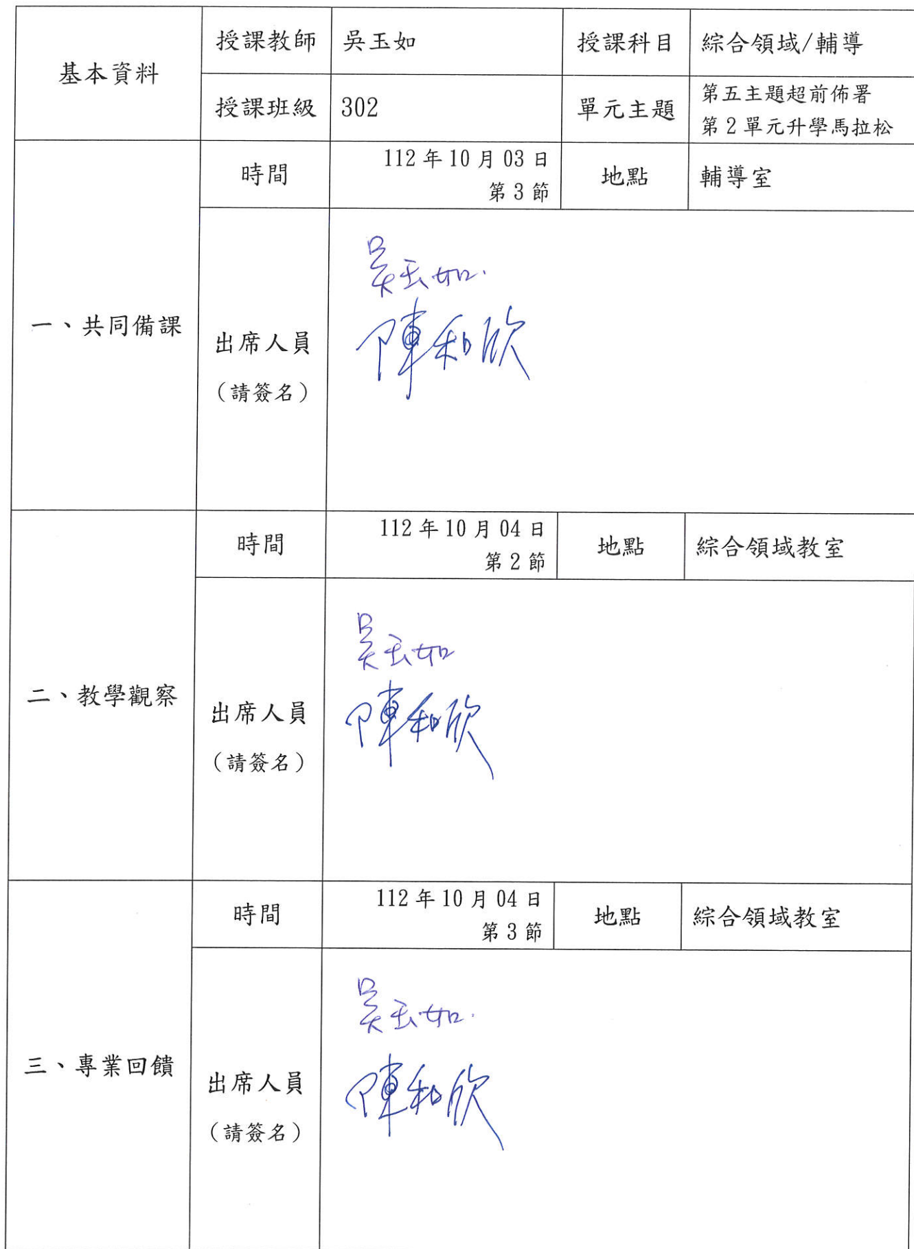
高雄市立旗津國中 112 學年度第 1 學期公開授課簽到表