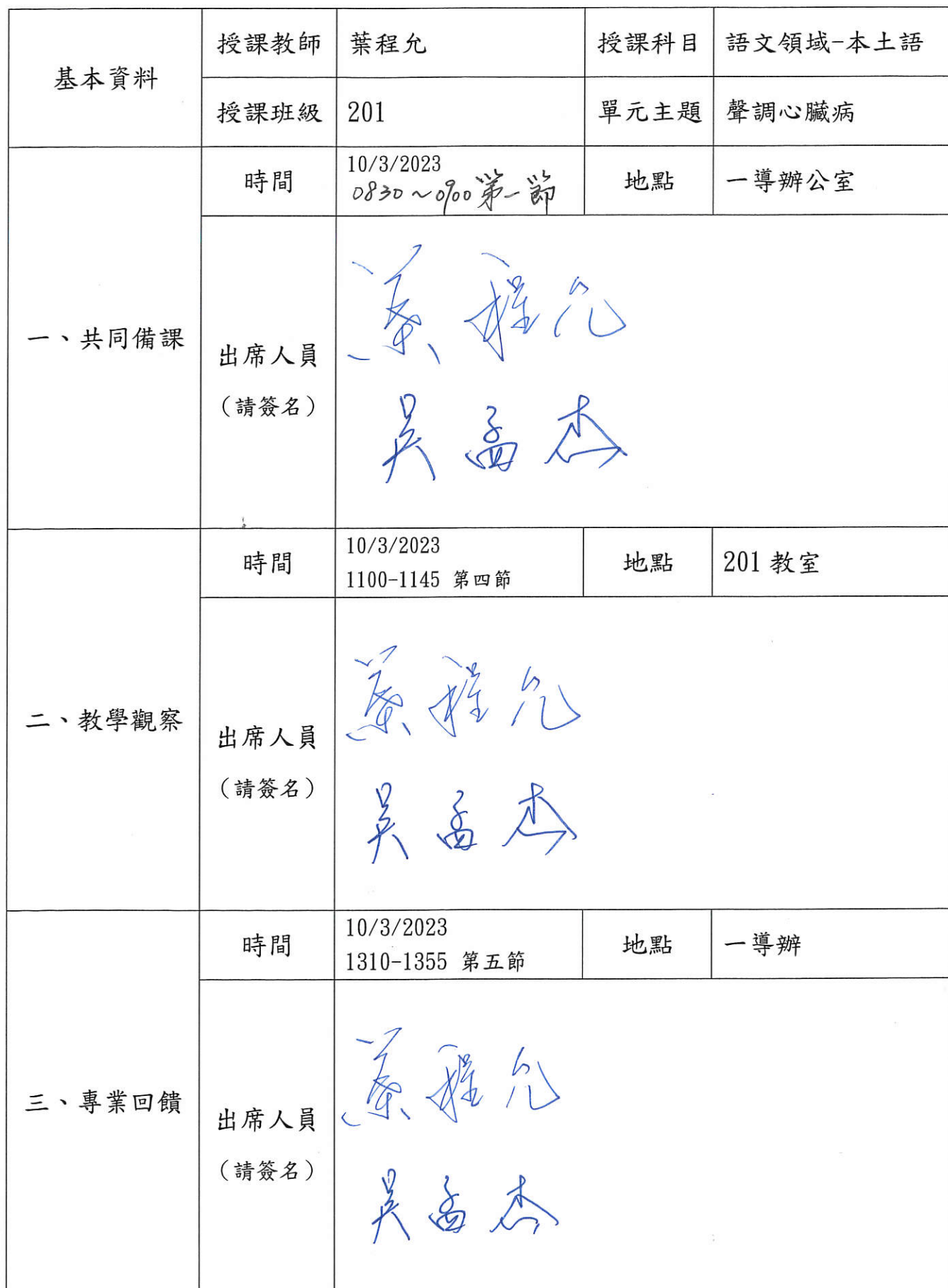
高雄市立旗津國中 112 學年度第 1 學期公開授課簽到表